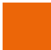
PANTONE Pantone 166