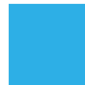
PANTONE Pantone 298