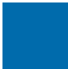
PANTONE Pantone 2384

Barevné odstíny samolepících fólií a dalších materiálů musí být identické s předepsanými barvami.