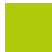
PANTONE Pantone 390