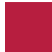
PANTONE Pantone 201