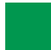
PANTONE Pantone 347