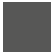
PANTONE Pantone Cool Gray 9