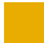
PANTONE Pantone 124